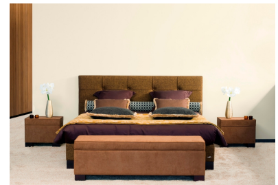
Lattenrost oder Boxspring: ebenso ergonomisch wie luxuriös verarbeitet!